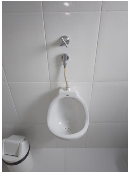
Foto 13 – Manutenção de mictório no banheiro masculino do 2º pavimento

Deverá ser realizada a troca da válvula de descarga para mictório (Foto 13) com acionamento por pressão e fechamento automático do banheiro masculino no 2º pavimento. A nova válvula deverá ser da marca Deca, Docol, Tigre ou similar.